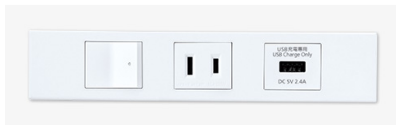
Sプレート + スイッチ + コンセント + USBコンセント

自宅にカウンターデスクを設置する場合には、USBが直接使える省スペースコンセントの設置もおすすめします。スマートフォンはもちろん、周辺機器を直接コンセントにつなげれば、コンセントまわりがスッキリします。