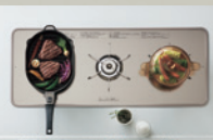
トリプルワイドガス