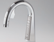
スリムセンサー水栓浄水器一体