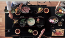
対面操作マルチワイドIH

申込期間 2024年8月1日(木) ▶ 2024年11月29日(金) 弊社受注分 納入は12月31日まで