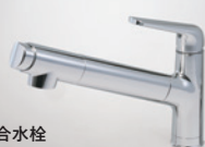
混合水栓 サラサラワイドシャワー 浄水器一体(クロムメッキ)