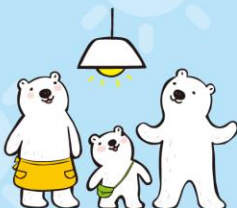
しょうめい おうちの照明