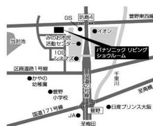
パナソニックリビングショールーム 箕面