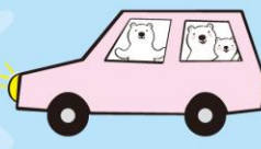
じどうしゃ 自動車のライト