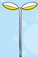
がいろとう 街路灯