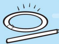
こうとう けい光灯