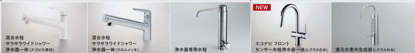
混合水栓 サラサラワイドシャワー 浄水器一体 (スゴピカ素材)