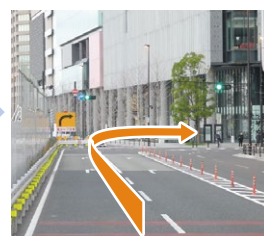
C 「梅田ランプ東」交差点の次の信号を右折