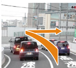
A 阪神高速11号池田線「梅田」出口を右折