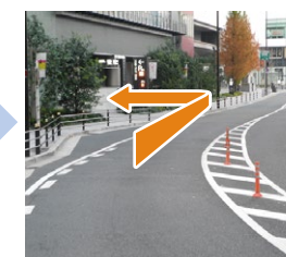
G カーブの先すぐ左側に駐車場入口(グランフロント南館P)