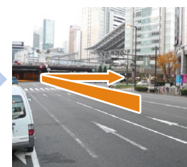
E 「芝田」交差点を右折