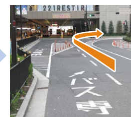
F 道に沿って、右方向に進む注) 直進は、バス専用です。