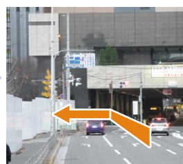
B 「梅田ランプ東」交差点を左折