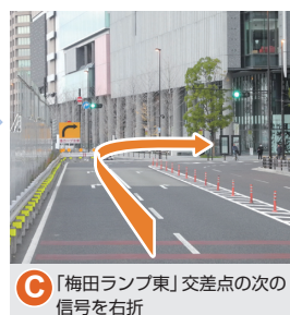
C 「梅田ランプ東」交差点の次の信号を右折