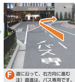
F 道に沿って、右方向に進む注) 直進は、バス専用です。