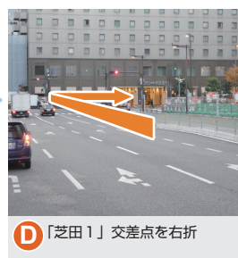
D 「芝田1」交差点を右折