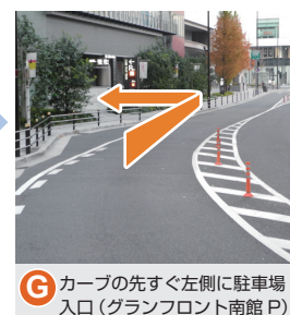
G カーブの先すぐ左側に駐車場入口(グランフロント南館P)