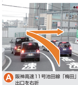
A 阪神高速11号池田線「梅田」出口を右折