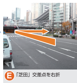
E 「芝田」交差点を右折