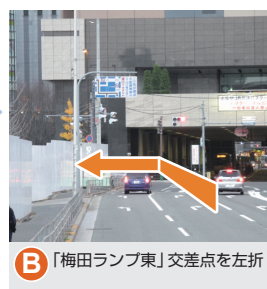
B 「梅田ランプ東」交差点を左折