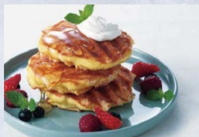
ワッフル風パンケーキ