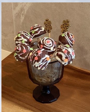
鈴カステラのロリポップ

お子様と一緒に作りませんか♪ 大人のみも大歓迎！ 最新のIHでお試しいただけます！