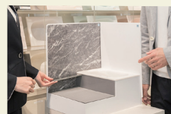
浴槽・壁柄コーディネート