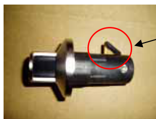
この部分が開状態でないとは引っ込まない

②ダイヤル錠を開状態にしておかないと、ロックがかかったままの状態では扉からダイヤル錠を取り出しできない(取り付け時も同様にして下さい)