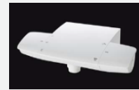
スゴピカ(ラウンド)