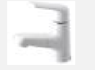
マルチシングルレバー 洗面〈シーライン〉