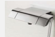
メタル（スクエア・ささっとキレイ仕様）