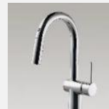
フロントセンサー水栓