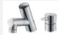
タッチレス水栓 〈ラシス〉