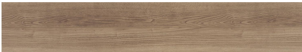
サステナブルフローアーS ダブルコート KEESHV23BMT 15,950円 (税抜14,500円)/ケース(1.65㎡)