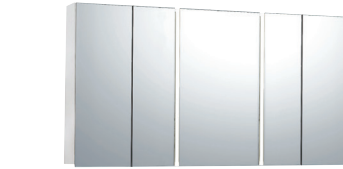
Aタイプ(センターミラー-W500×1)