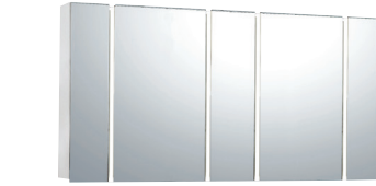
Bタイプ(センターミラー-W500×2)