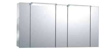
Bタイプ(センターミラー-W500×2)