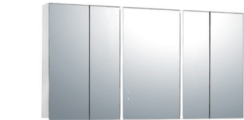
Aタイプ(センターミラー-W500×1)