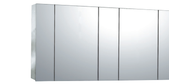
Bタイプ(センターミラー-W500×2)