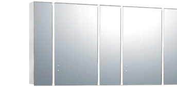
Bタイプ(センターミラー-W500×2)