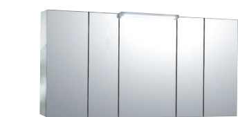
Aタイプ(センターミラー-W500×1)