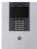
ロビーインターホン