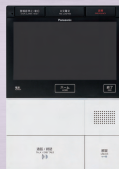
住戸部インターホン(親機)

万一の不具合に備え、 10年間の保証でご負担を最小限に。 信頼の 長期安心修理サービス です。