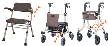
シャワーチェア Airプレミアム