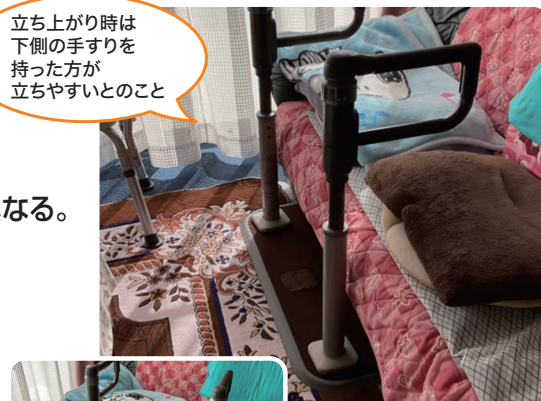
立ち上がり時は 下側の手すりを 持った方が 立ちやすいとのこと