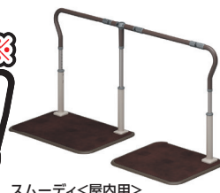
スムーディ<屋内用>

※<No.1表記について> 2022年5月期ブランドのイメージ調査 ●調査機関：日本マーケティングリサーチ機構 ●調査期間：2022年1月31日～2022年5月30日 ●調査方法：Webアンケート ●調査対象者：https://jmro.co.jp/r01174/ ●備考：本調査は個人のブランドに対するイメージを元にアンケートを実施し集計しております。本ブランドの利用有無は聴取しておりません。効果効能等や優位性を保証するものではありません。得票数が僅差の競合あり。