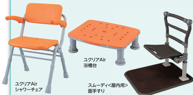
ユクリアAir シャワーチェア