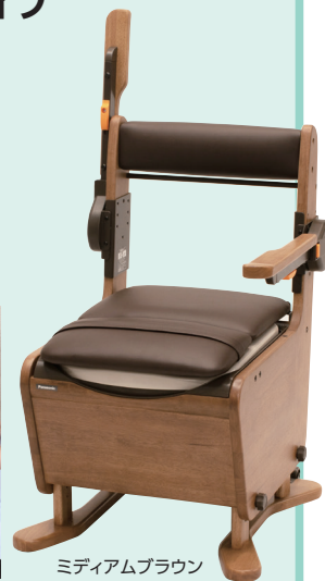
ミディアムブラウン