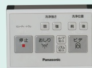
リモコン付き/なし