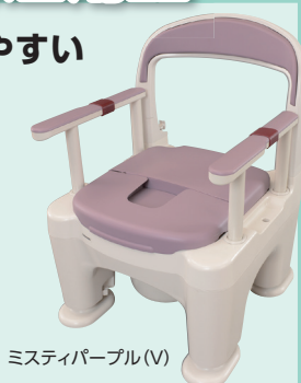
ミスティパープル(V)