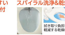
拭き取り負担を軽減する乾燥機能