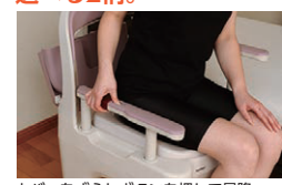
カバーをずらしボタンを押して昇降