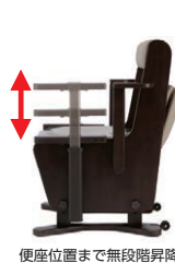
便座位置まで無段階昇降