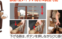
下げる時は、ボタンを押しながらひじ掛けを下げます。 上げる時は、ひじ掛けをつかんで上げます(ボタン操作不要)。