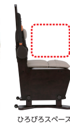
ひろびろスペース