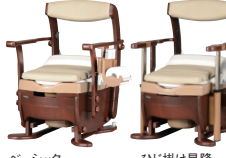
片手で持ててわかりやすいUDデザインのリモコン付