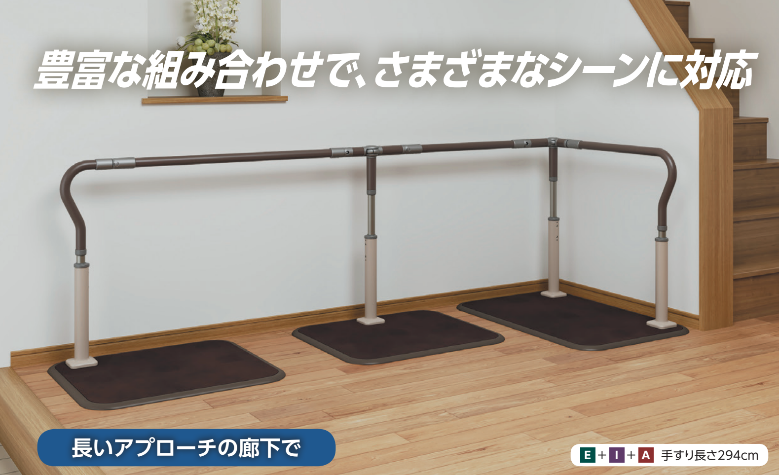
長いアプローチの廊下で