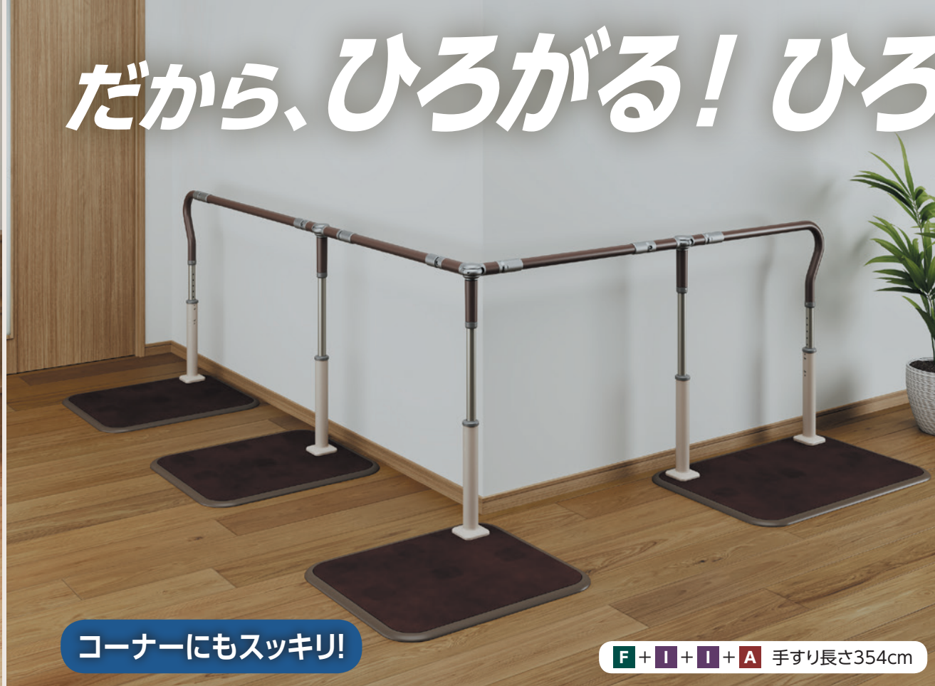
コーナーにもスッカリ！