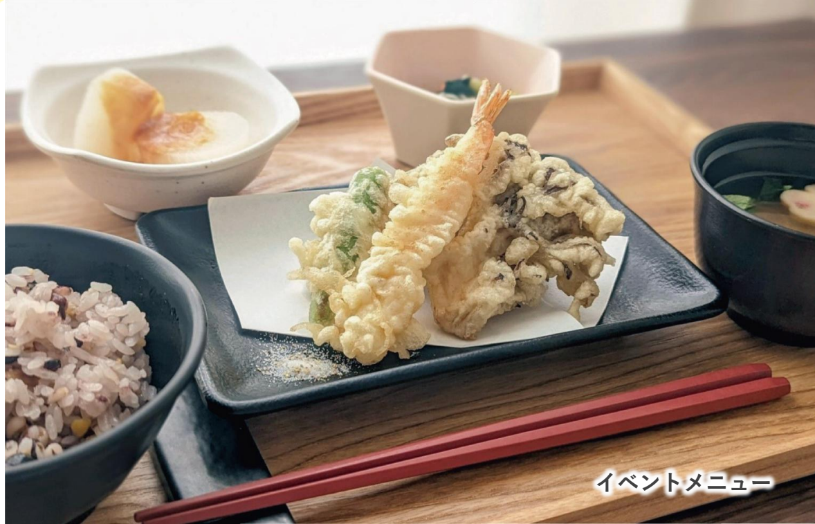
イベントメニュー