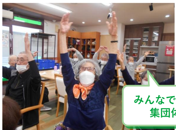
みんなで楽しく 集団体操