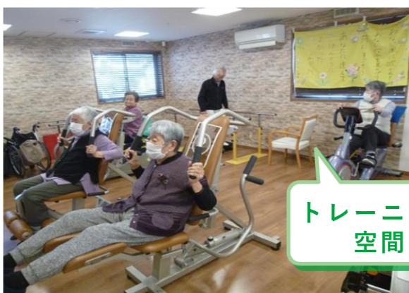
トレーニング 空間

片まひの方や、車いすをご利用で歩行が不安定な方も、スタッフが付き添いサポートします。