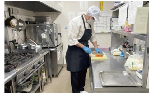
施設内キッチンの様子