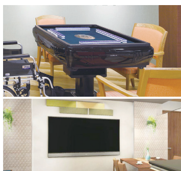
電動の麻雀卓、カラオケ機器、大型テレビを導入。

「プラチナ」フロアが拡大。3Fはアクティブスペースのある「プラチナ」フロアに変わります。