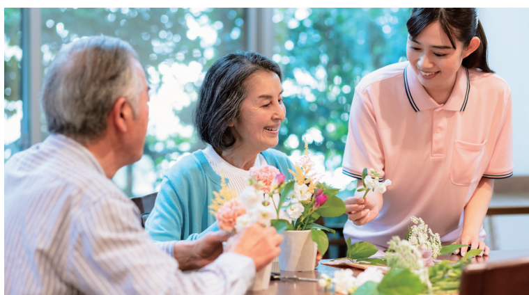
スタッフやボランティアによるアクティビティを毎日実施。 (手芸、書道、工作、フラワーアレンジメント、ほか)

スタッフの見守りの元、お好きな活動をお楽しみいただける「アクティブスペース」を新設。お部屋を出て、趣味活動や休憩などにご自由にお使いいただける、憩いの空間です。