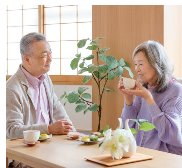
趣味活動や休憩に、少人数で交流しやすい空間設計。