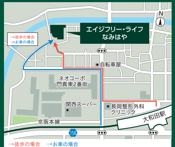
→徒歩の場合 →お車の場合

大阪府・有料老人ホーム設置運営指導指針による類型及び表示事項 ●施設類型: 介護付有料老人ホーム(一般型特定施設入居者生活介護) ●土地の権利形態: 賃借 ●居住の権利形態: 利用権方式 ●利用料の支払い方式: 選択方式 ●入居時の要件: 入居時要支援・要介護 ●介護保険: 大阪府指定介護保険特定施設(一般型特定施設) ●介護居室区分: 個室74室 夫婦部屋3室 ●一般型特定施設である有料老人ホームの介護にかかわる職員体制: 1.5:1以上 有資格者職員数: 看護職員9名(常勤職員4名、非常勤職員5名)、ケアマネジャー3名(常勤職員3名、非常勤職員0名)、機能訓練指導員2名(常勤職員2名、非常勤職員0名)、/夜間最少時の看護職員1名・休憩時0名(18時～翌9時) 2025年7月1日現在