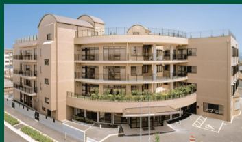
土地の権利形態: 賃借

【開設】1998年7月(平成10年) 【居室数】個室 74室・夫婦部屋 3室 〒571-0063 大阪府門真市常称寺町10-1 京阪本線「大和田駅」より徒歩約6分(約450m)