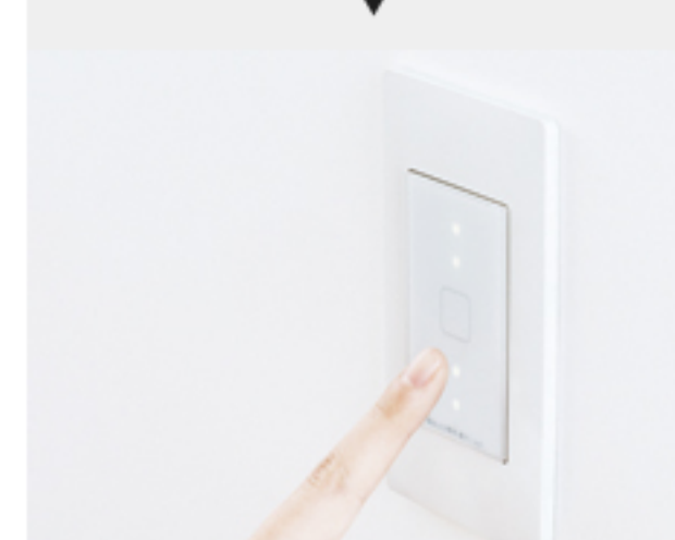
スイッチ・コンセント