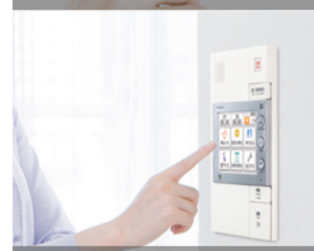
インターホン・防犯機器