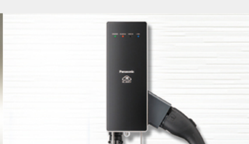
電気自動車充電設備