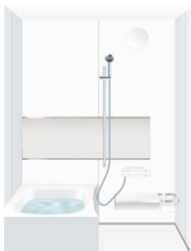
セミワイドミラー