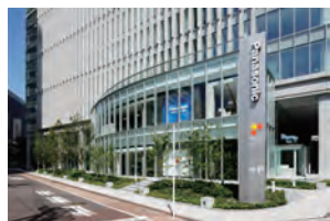
パナソニックリビング ショールーム 横浜 (横浜プラザビル1F)