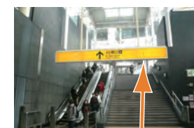
I 階段を上がります。