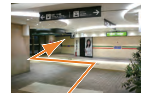
G 突き当りを左に曲がり、扉を てたら右へ曲がります。