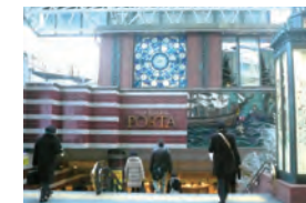
E 東口ポルタの階段を下ります。