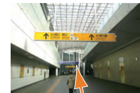
H きた東口Aに直進します。