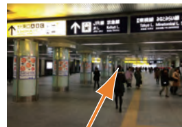
B 東横線改札からきた通路へ