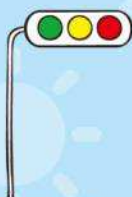
しんごうき 信号機