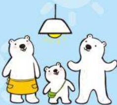
しょうめい おうちの照明