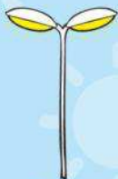
がいろとう 街路灯