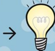
はくねつとう 白熱灯