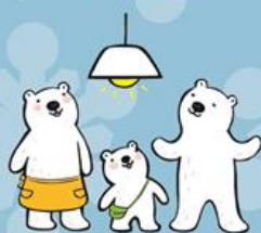
しょうめい おうちの照明