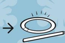
こうとう けい光灯