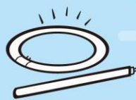
こうとう けい光灯