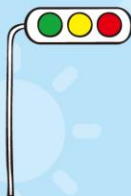
しんごうき 信号機