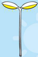
がいろとう 街路灯