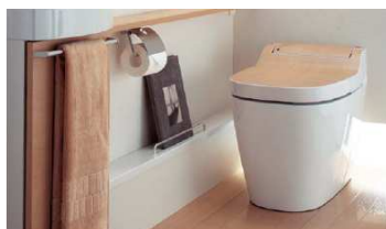
流すたびに自分でおそうじ 〈全自動おそうじトイレ〉アラウーノ