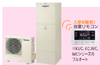
人を感じし、風呂加熱を開始 〈自然冷媒(CO 2 )ヒートポンプ給湯器〉エコキュート