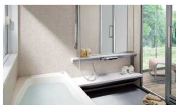
硬くてなめらかな浴槽が人気！ 〈システムバスルーム〉ココチーノ