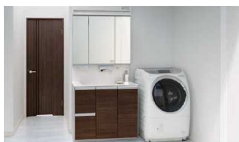
タッチレス水栓とLEDを搭載できる 〈洗面化粧台〉ウツクシーズ