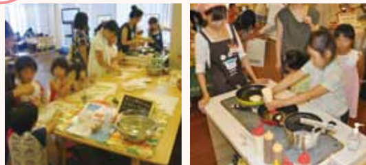
第1回食育フェスティバルの様子

【食育フェスティバルを応援して下さる企業】 西日本新聞社/西部ガス株式会社/サン・フカヤ/有限会社矢部屋このみ園本舗/松尾農園/有限会社江口蒲鉾/アチャートカフェ/カゴメ株式会社/野菜王国/角味噌醤油株式会社/天の川酒造株式会社/ふくおか市民ネットワーク/有限会社GMGコーポレーション/パナソニック株式会社エコソリューションズ社