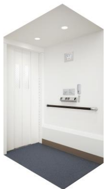
フィブロホワイト柄