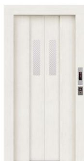
フィブロホワイト柄