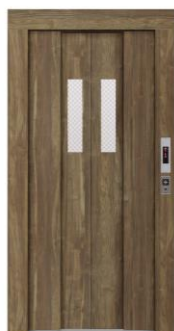
ウォールナット柄 VERITIS