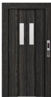
スモークオーク柄 VERITIS