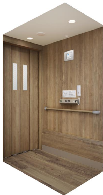
【小型エレベーター「XLウェルハートV」設置イメージ】