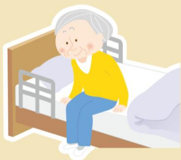
ベッドからの 起き上がり訓練