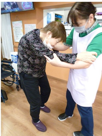
【立ち上がり】車いすから 立ち上がって歩けるように