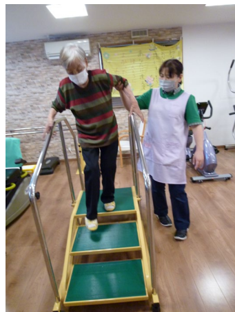
【段差】上がり框や階段を移動し 外出が続けられるように