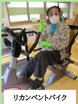
リカンベントバイク