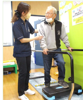
【段差】玄関外のポストから 新聞を取りに行けるように