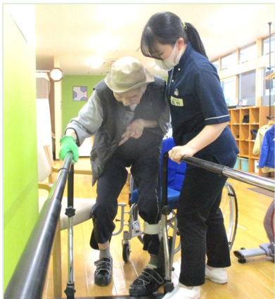
【移乗】車いすから 楽に立ち上がれるように